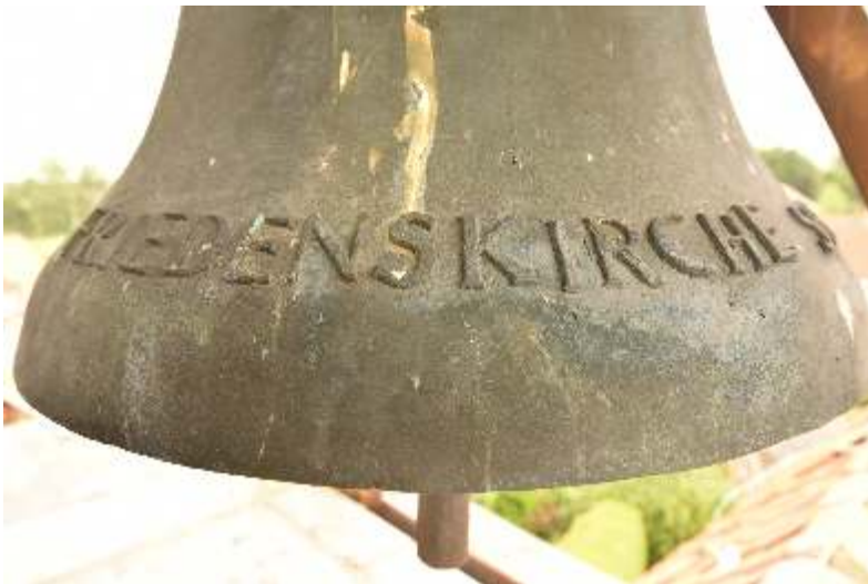
Glocke der Friedenskirche Sendenhorst

Um 8, 12 und 18 Uhr läutet eine Glocke der Friedenskirche und der Nicolaikirche. Zeit, kurz innezuhalten, den Tag zu bedenken oder zu beten.